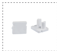
Tapa End Cap