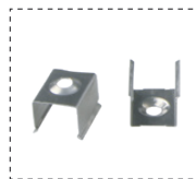
Clip sujeción Fixing clip

*Las imágenes son ilustrativas. Los productos finales están sujetos a cambios sin aviso previo. *Images for reference only. Subject to changes without prior notice.